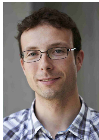
Simon Rickenbacher Bahnvermessung Ingenieurvermessung Monitoring terra vermessungen ag