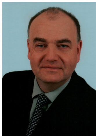
Stefan Karch Gesamtsystem Bahn und Innovation RAILWAY DESIGN & INNOVATION AG